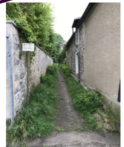
Entrée du chemin du Mossu