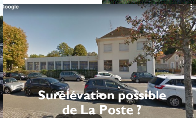
Surélévation possible de La Poste ?