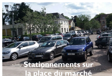
Stationnements sur la place du marché