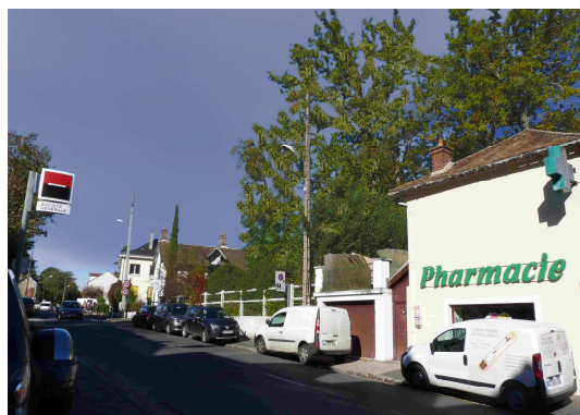
ESPACE BOISÉ ACTUEL

La mairie ne fait rien pour éviter que Bois le Roi ne se transforme en une banlieue . Ce n'est pas ce que veulent les habitants . Ils se sont éloignés des zones très urbanisées et ont choisi Bois le Roi pour son cadre de vie avec ses grands arbres et ses maisons entourées de jardins .