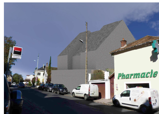
IMPACT DU PROJET