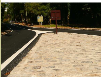
Route de Bourgogne Entrée pavée Bois Le Roi ZA

Ces travaux ont pour maîtres d'œuvre, d'une part le Conseil Général et d'autre part la copropriété du Port Baquin. L'utilisation de matériaux de qualité et le soin apporté à cette réalisation en font une réussite bien intégrée dans le paysage . Bravo !