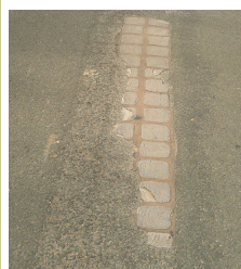
Pavés plastiques abîmés après quelques années

A Bois le Roi, les pavés disparaissent , sans que l'on sache vraiment ce qu'ils deviennent. Les habitants se voient infliger bitume et béton , sans égard pour l'aspect de la rue et sans aucune concertation.