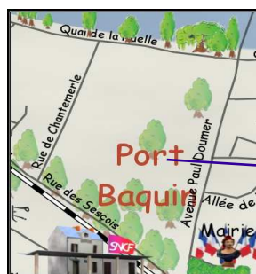
Situé face à la mairie