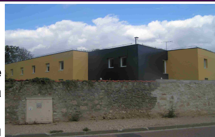
Nouveau bâtiment sur 2 niveaux