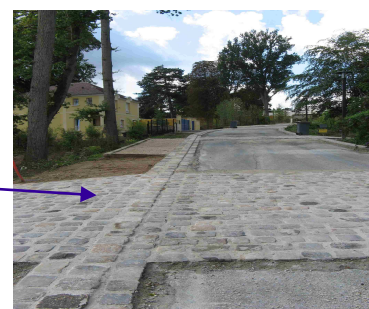
Port Baquin Chemin pavé