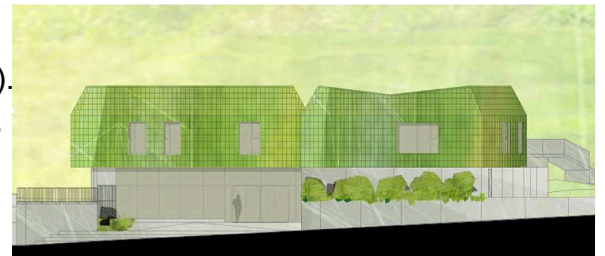
Centre culturel (projet municipal) vu de l'avenue de la forêt: L'aspect boisé a disparu

Notre association, créée en 1992, agit pour que Bois Le Roi évolue sans sacrifier ce qui en fait une commune préservée et pour que s'améliorent la qualité et le cadre de vie qui nous tiennent à cœur. Nos constats et nos propositions se font en toute indépendance des autres acteurs de la vie publique à Bois le Roi.