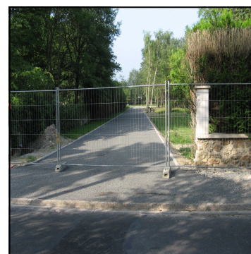
22 rue Moreau de Tours 3 nouveaux terrains derrière un bâtiment existant.

Depuis 1992, pour préserver le caractère naturel de la commune, les constructions ou lotissements derrière d'autres maisons sont interdites. C'est ce que garantit le PLU actuel. (PLU = texte réglementant les constructions)