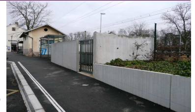
Local poubelle et mur en béton

Pourquoi les modifications du PLU, demandées par la Mairie, ne consistent-elles qu'à ouvrir de nouveaux espaces à construire? Pourquoi à l'instar de villes comme Barbizon ou Arbonne, n'en profite-t-on pas pour protéger le patrimoine qui fait la valeur de Bois le Roi ?